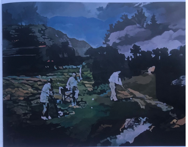
Un coup de dés, huile sur toile, 97 x 130 cm, 2019

ACTU Galerie Belem, Paris 3e jusqu'au 23 janvier 2020.